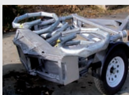
Slik ser Vorteq ut etter påkjørsel. Fremdeles kjørbart!