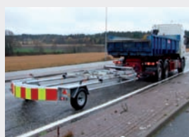
Varselpanelet kan enkelt slås ned under transport/lagring.